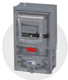
CAIXA DE MEDIÇÃO MONOFÁSICA COM ACESSO PARA DISJUNTOR E VISOR DE VIDRO

Dimensões: 340 x 200 x 141 mm Espessura: 3 mm