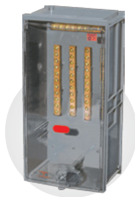
CX CB200 COM OU SEM BARRAMENTOS

Dimensões: 520 x 260 x 186 mm Espessura: 3 mm