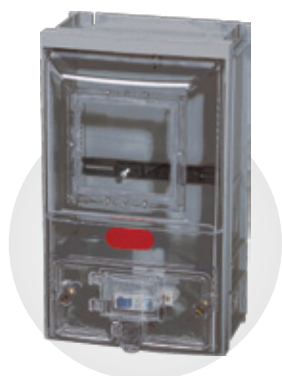
CAIXA DE MEDIÇÃO TRIFÁSICA COM ACESSO PARA DISJUNTOR E VISOR DE VIDRO

Dimensões: 340 x 200 x 141 mm Espessura: 3 mm