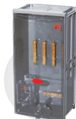
CX CB100 COM OU SEM BARRAMENTOS

Dimensões: 520 x 260 x 186 mm Espessura: 3 mm