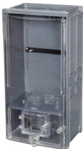
CX MED POLIF N6

Dimensões: 520 x 260 x 186 mm Espessura: 3 mm