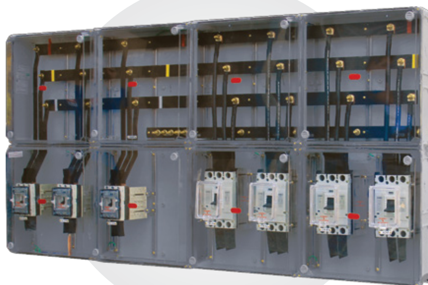
QGBT Dimensões: 1140 x 2280 x 225 mm